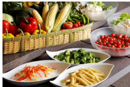
朝食ビュッフェイメージ