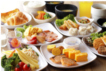
朝食イメージ 料金：1,500円 (ご宿泊で事前予約のお客様は1,300円) すべて税込

「Northern Buffet Restaurant Hana 華」では、北海道を訪れる国内外のお客様に北海道産食材を使った高品質なメニュー・サービスを提供することにより、北海道観光のリピーター創出に寄与してまいります。