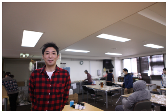
▲美園に構える就労継続支援A型事業所。仕事の約7割がグループ会社からの業務