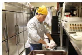
▲施設外就労として、飲食事業店舗での料理やタレ類の仕込作業