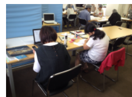
▲アパレル事業からはグッズ制作、WEB事業からはデータ入力作業など